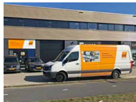
svt Products BV te Bleiswijk

svt Products BV in Bleiswijk is uw aanspreekpunt en leverancier voor producten en systemen voor passieve bouwkundige brandpreventie. We denken graag mee in oplossingen en kunnen snel leveren vanuit ons eigen magazijn of via onze partners. Bovendien bieden we handige tools voor het vinden van de juiste brandwerende oplossing en het registreren en rapporteren van uw projecten.